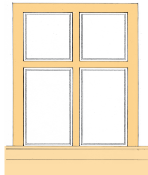
Début 17 e siècle